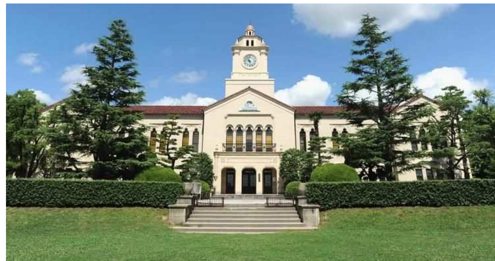
KWANSEI GAKUIN UNIVERSITY