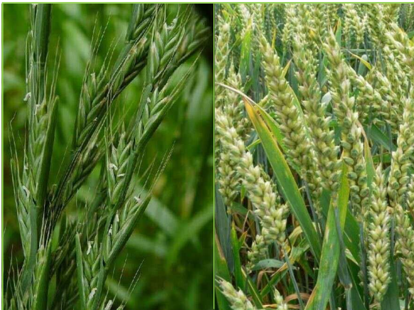
毒麦 the Tares

単子葉植物イネ科ドクムギ属の一年生植物で、休眠からの覚醒など、生活史がムギ類と同調しているムギ類の擬態雑草、高さは30~80cm。初夏に穂をつけ、結実する。ドクムギの混入した飼料を食べると家畜は中毒を起こすが、この毒はドクムギの毒ではなく、ドクムギにつく糸状菌の毒であるとも言われている。