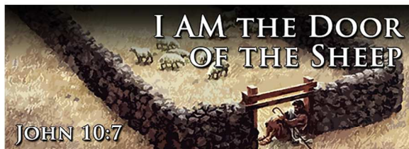
第二神殿(エルサレム神殿、ヘロデ神殿)にある門等 ⇒ 「羊の門」もある