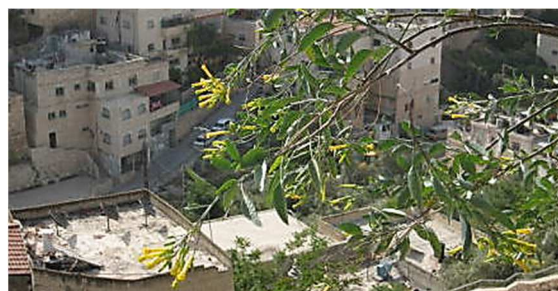
←ダビデの町考古学公園のからし種の木 https://www.nikomaru.jp/acts