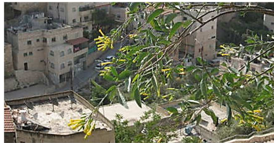
←ダビデの町考古学公園のからし種の木 https://www.nikomaru.jp/acts